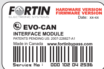
Module label | Étiquette sur le module